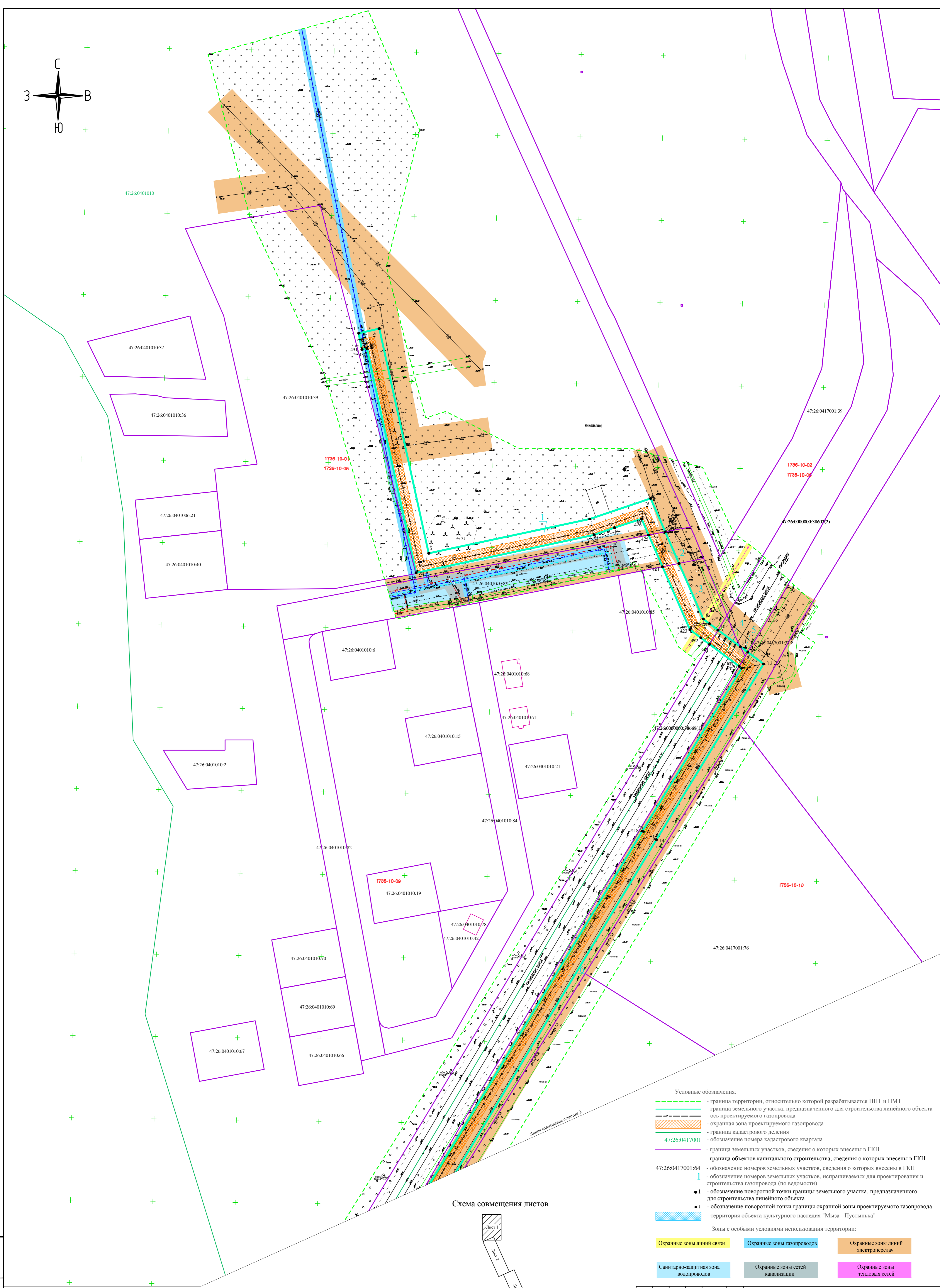
Схема совмещения листов