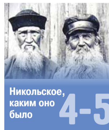
Никольское, каким оно было