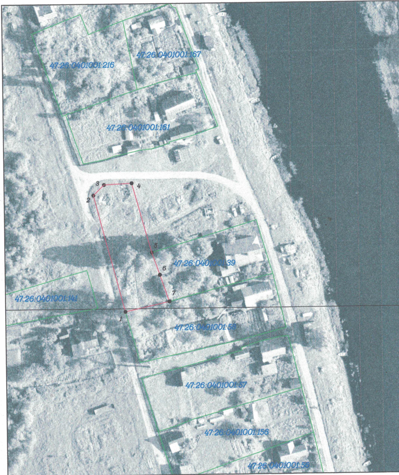
Схема расположения земельного участка или земельных у

Схема составлена в соответствии с Приказом Минэкономразвития России №762 от 27.11.2014 г.