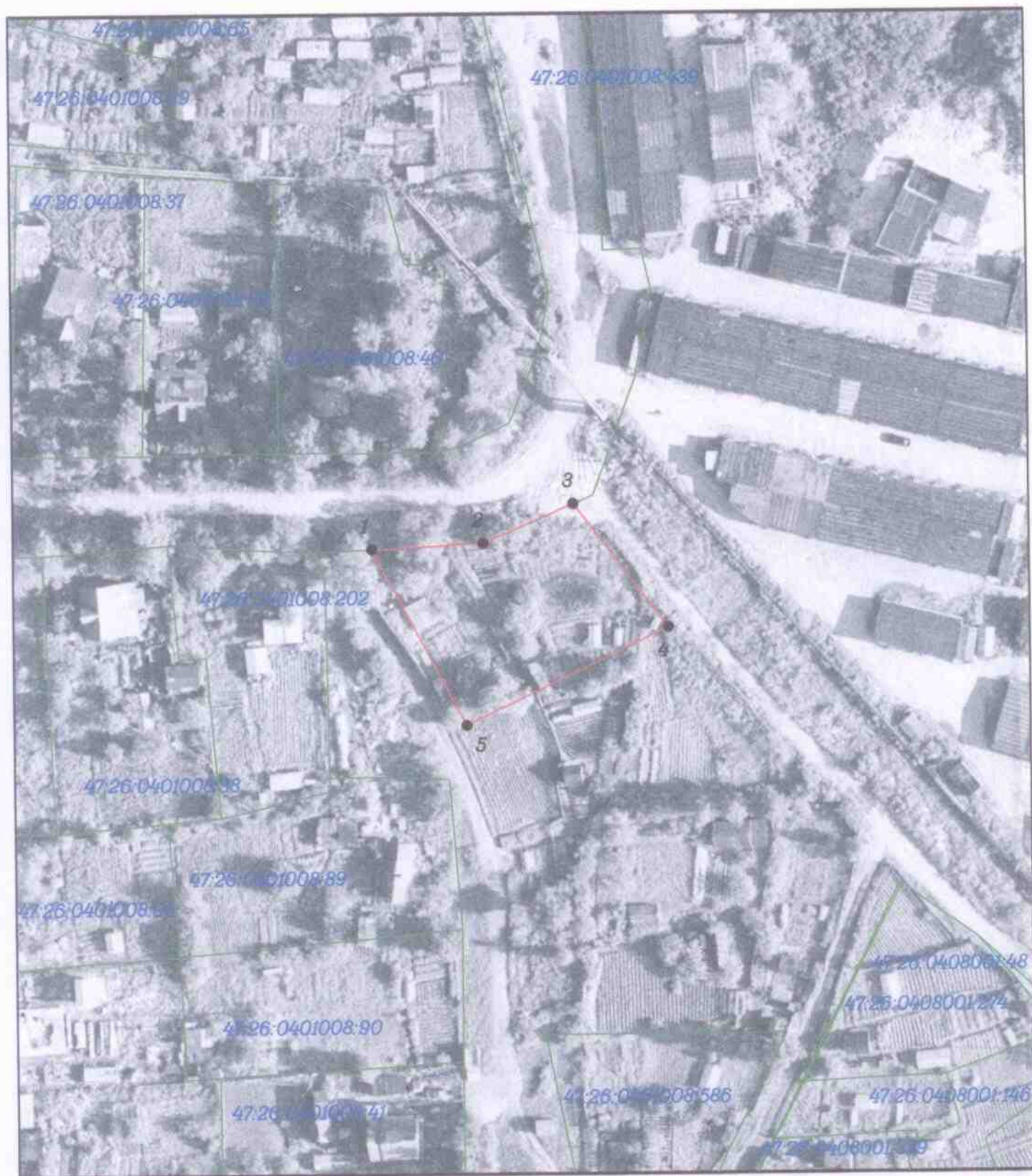
Схема расположения земельного участка или земельных участков

Схема составлена в соответствии с Приказом Минэкономразвития России №762 от 27.11.2014 г.